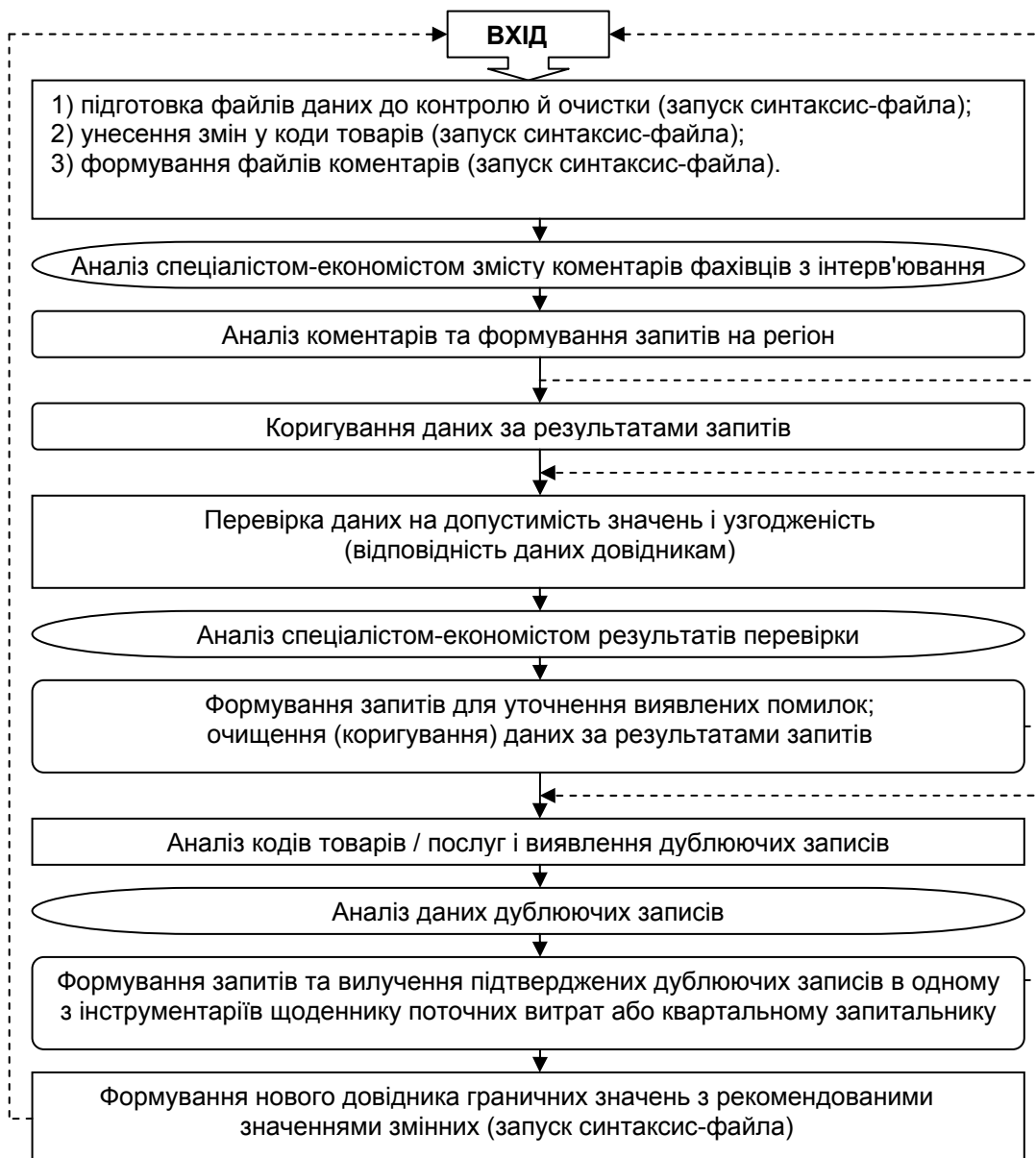
Схема етапів робіт з контролю та очищення даних статистичних формулярів